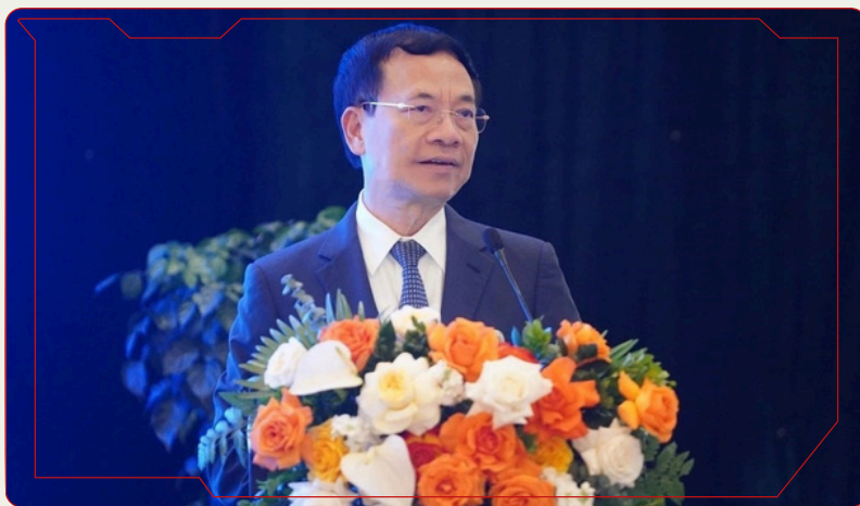
Bộ trưởng Nguyễn Mạnh Hùng phát biểu tại Diễn đàn "AI trong kỷ nguyên số"

AI không chỉ là công nghệ, mà đã trở thành một loại hạ tầng quốc gia mới, hạ tầng trí tuệ của Việt Nam, sẽ ảnh hưởng tới mọi lĩnh vực của đời sống, từ kinh tế, giáo dục, y tế cho đến an ninh quốc phòng. Việt Nam cần nhanh chóng xây dựng trung tâm siêu tính toán AI quốc gia dùng chung, và dữ liệu AI mở dùng chung. Cần thực hiện AI hoá như là điện khí hoá, nhưng Việt Nam cần AI hoá nhanh hơn, nhanh nhất có thể.