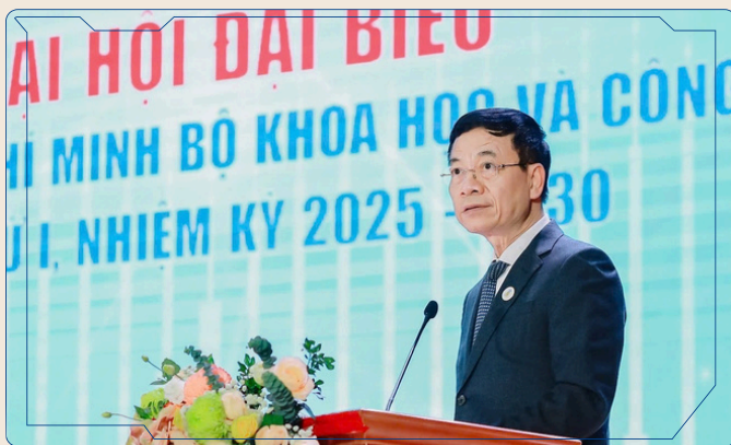
Bộ trưởng Nguyễn Mạnh Hùng phát biểu tại Đại hội Đoàn Thanh niên cộng sản Hồ Chí Minh của Bộ Khoa học và Công nghệ

Tại Đại hội Đoàn Thanh niên cộng sản Hồ Chí Minh của Bộ Khoa học và Công nghệ, Bộ trưởng Nguyễn Mạnh Hùng nhắn nhủ các bạn trẻ hãy sống hết mình, dẫn thân và sáng tạo, để mỗi công việc, mỗi thử thách đều trở thành dấu ấn riêng. Thông điệp này khích lệ thế hệ trẻ không chỉ tham gia, mà còn chủ động kiến tạo, để khi nhìn lại, mỗi người đều có thể tự hào về những đóng góp cho Bộ, cho ngành và cho đất nước.