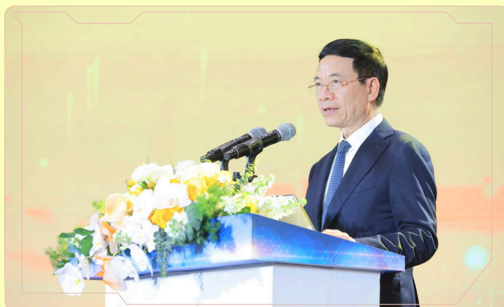
Bộ trưởng Nguyễn Mạnh Hùng phát biểu tại Diễn đàn quốc gia phát triển doanh nghiệp công nghệ Việt Nam năm 2025

Tại Diễn đàn quốc gia phát triển doanh nghiệp công nghệ năm 2025, Bộ trưởng Nguyễn Mạnh Hùng nhấn mạnh Việt Nam cần bước sang một giai đoạn phát triển mới của Make in VietNam – không chỉ làm chủ công nghệ cho mình, mà hướng tới tự chủ và dẫn dắt. Với thông điệp "Make in VietNam to Lead: Sáng tạo tại Việt Nam, làm ra tại Việt Nam – Để dẫn dắt", Bộ trưởng kêu gọi cộng đồng doanh nghiệp công nghệ Việt Nam tiên phong giải các bài toán lớn của đất nước, làm chủ nền tảng, công nghệ lõi và từng bước tạo ra chuẩn mực mới cho thị trường khu vực và thế giới.