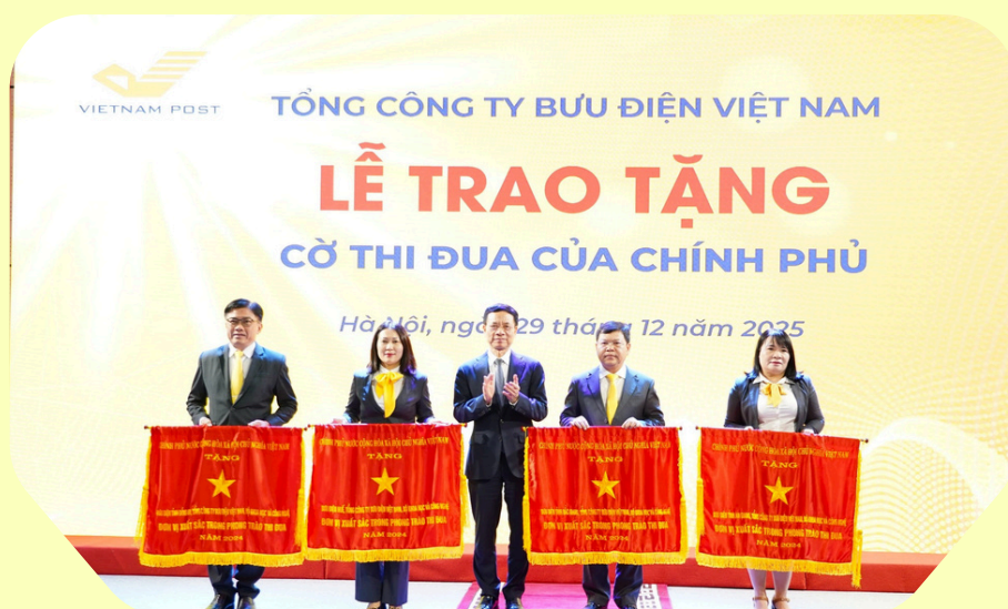
Bộ trưởng Nguyễn Mạnh Hùng trao cờ thi đua của Chính phủ cho 4 tập thể thuộc Tổng công ty Bưu điện Việt Nam.

Năm 2025 đi qua trong bối cảnh thế giới tiếp tục biến động nhanh chóng, cạnh tranh công nghệ, cạnh tranh chuỗi cung ứng ngày càng gay gắt; mô hình kinh doanh, phương thức cung ứng dịch vụ thay đổi nhanh dưới tác động của kinh tế số, thương mại điện tử, logistics thông minh. Trong bối cảnh đó, Bưu điện Việt Nam (Vietnampost) đã nỗ lực rất lớn, vượt qua nhiều khó khăn, duy trì được thị trường, giữ vững được mạng lưới, mở rộng được dịch vụ, khẳng định vai trò là lực lượng nòng cốt của ngành bưu chính quốc gia.