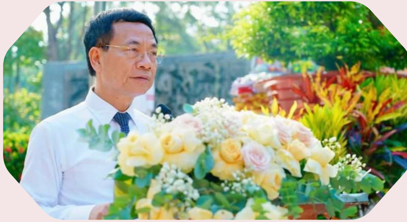
Bộ trưởng Nguyễn Mạnh Hùng phát biểu tại Lễ dâng hương tưởng niệm các Anh hùng liệt sĩ ngành Bưu điện.

Những nén tâm nhang dâng lên các anh, các chị ngày hôm nay là lời hứa quyết tâm của đội ngũ cán bộ, công chức, viên chức, nhân viên và người lao động toàn ngành BCVT và KHCN, nguyện kế thừa xứng đáng sự nghiệp cách mạng vẻ vang mà các anh hùng, liệt sĩ đã chuyển giao, kế thừa và phát huy truyền thống anh hùng bất khuất của các thế hệ cha anh, ra sức thi đua học tập, rèn luyện, lao động, sản xuất, phát huy tinh thần "Tiên phong - Sáng tạo - Đột phá - Tận tụy - Trung dũng - Nghĩa tình" của hai ngành Bưu điện và KHCN, và với phương châm hành động "Làm gương, Kỷ cương, Trọng tâm, Bút phá", tham gia tích cực các phong trào thi đua yêu nước, hoàn thành xuất sắc mọi nhiệm vụ, góp phần xây dựng và bảo vệ Tổ quốc Việt Nam xã hội chủ nghĩa.