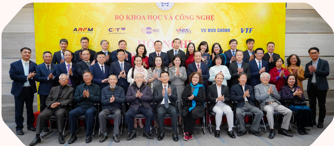
Bộ trưởng Nguyễn Mạnh Hùng, Thứ trưởng Phạm Đức Long chụp ảnh lưu niệm với lãnh đạo các đơn vị qua các thời kỳ.

Điều này đòi hỏi viễn thông bắt tay sâu với các ngành dọc, hiểu bài toán sản xuất, vận hành, hiểu chi phí của khách hàng, và đồng sáng tạo giải pháp, không chỉ bán sim. Khi đó nhà mạng phải trở thành nhà nghiên cứu - phát triển, không chỉ là nhà vận hành mạng.