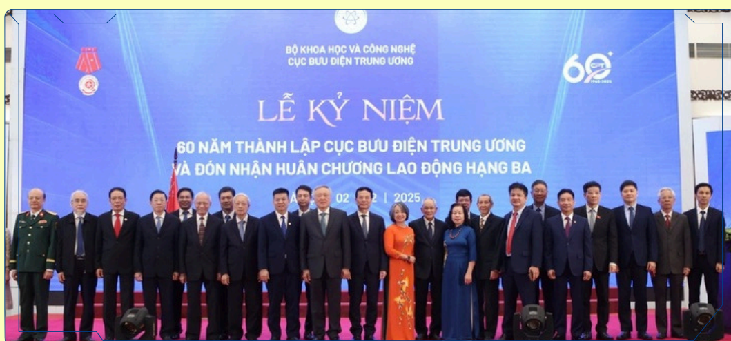
Phó Thủ tướng Nguyễn Hòa Bình, Bộ trưởng Nguyễn Mạnh Hùng chụp ảnh lưu niệm cùng các thế hệ lãnh đạo Cục Bưu điện Trung ương tại Lễ kỷ niệm 60 năm thành lập và đón nhận Huân chương Lao động hạng Ba của Cục Bưu điện Trung ương

Trải qua 60 năm xây dựng và phát triển, Cục Bưu điện Trung ương đã không ngừng rèn luyện và trưởng thành, khẳng định vai trò là lực lượng thông tin liên lạc đặc biệt tin cậy, phục vụ sự lãnh đạo, chỉ đạo kịp thời của Trung ương Đảng và Nhà nước, nhất là trong những thời khắc lịch sử quan trọng của đất nước. Các thế hệ cán bộ của Cục đã thể hiện ý chí kiên cường, bản lĩnh chính trị vững vàng, tinh thần trách nhiệm cao và năng lực chuyên môn sâu, đóng góp xứng đáng vào sự nghiệp bảo vệ và phát triển đất nước.